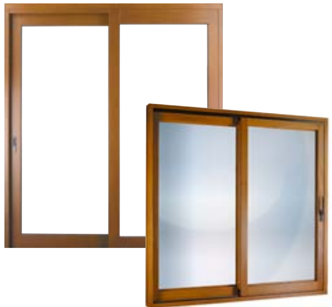
De hef-schuifdeur van Profel is een technisch hoogstandje dat een vlekkeloze werking combineert met een maximum aan veiligheid.

Zie ook monorail en duorail in onze schuiframen brochure F5071